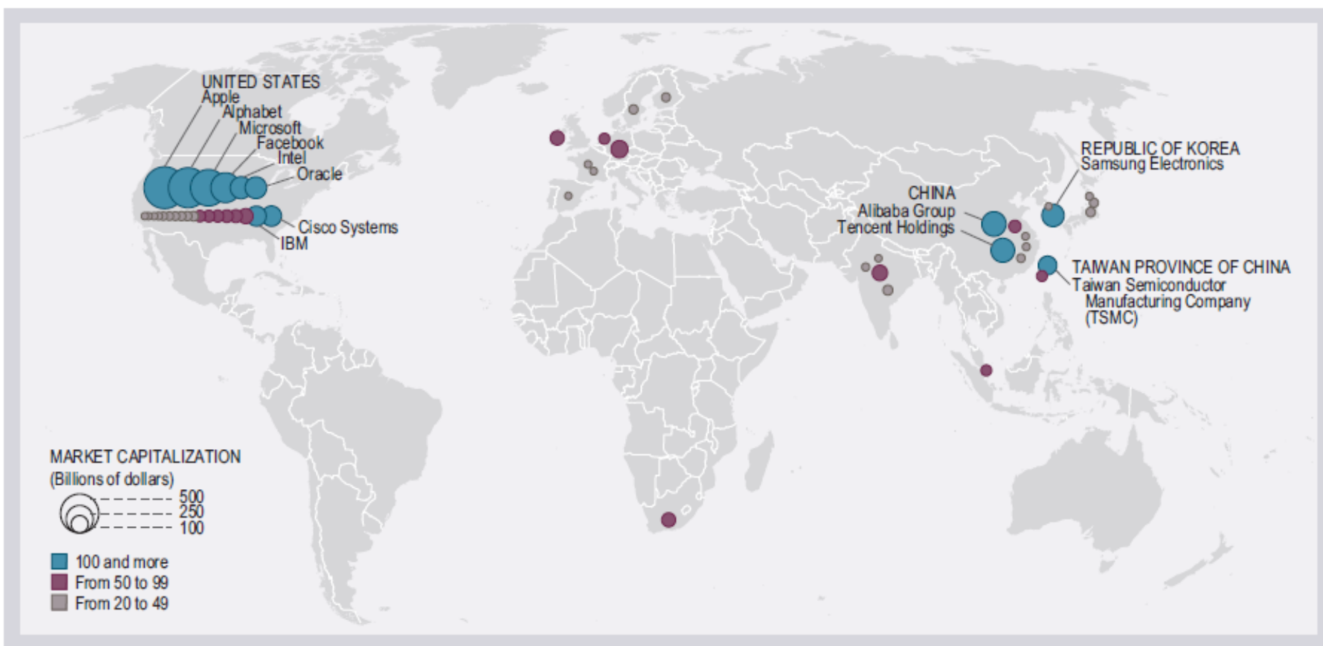
FIGURE 3.5 Geographic location of big tech companies, selected companies