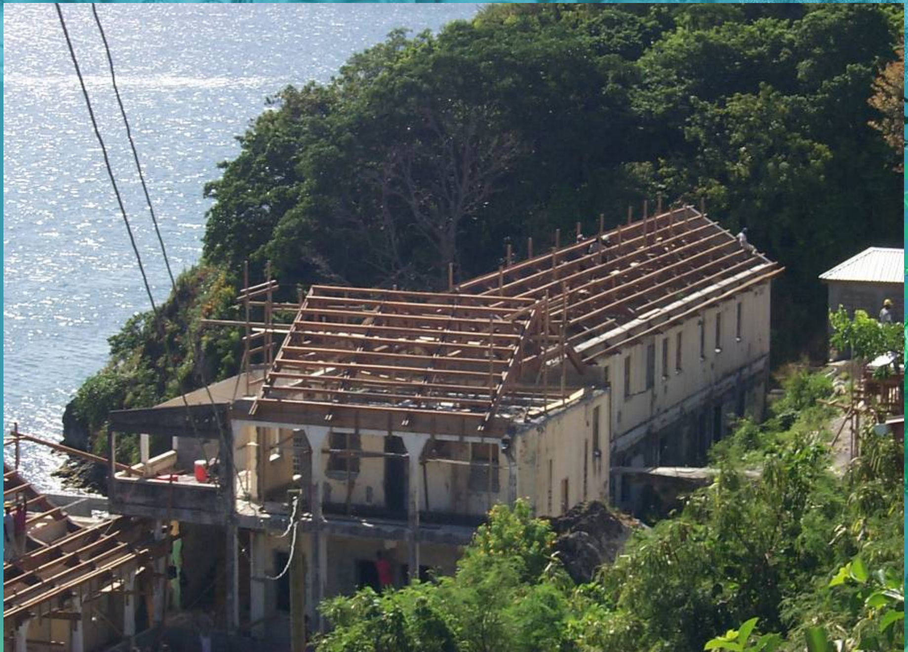
Hospital en construcción en St George's, Grenada