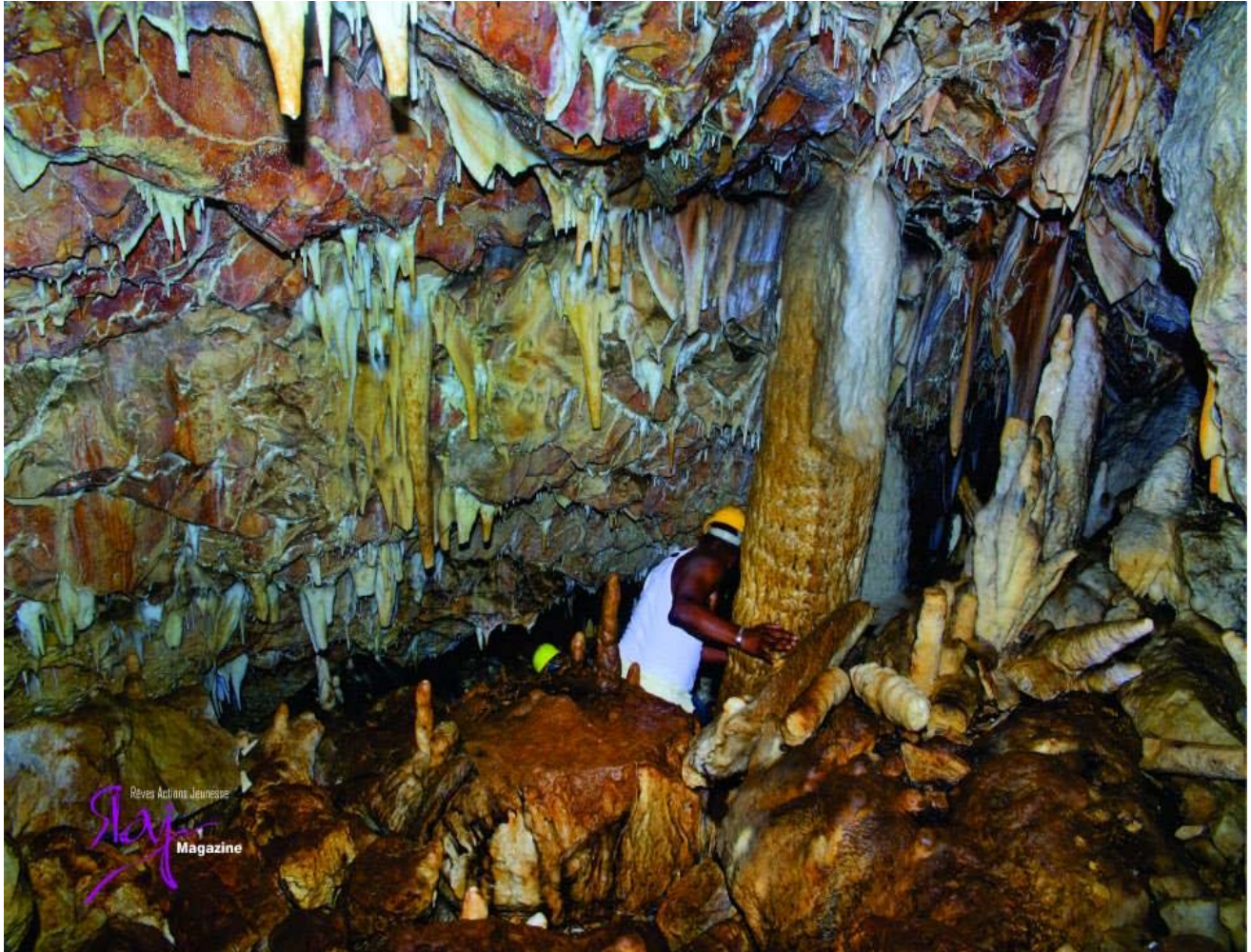
Grotte Belony (Pestel)