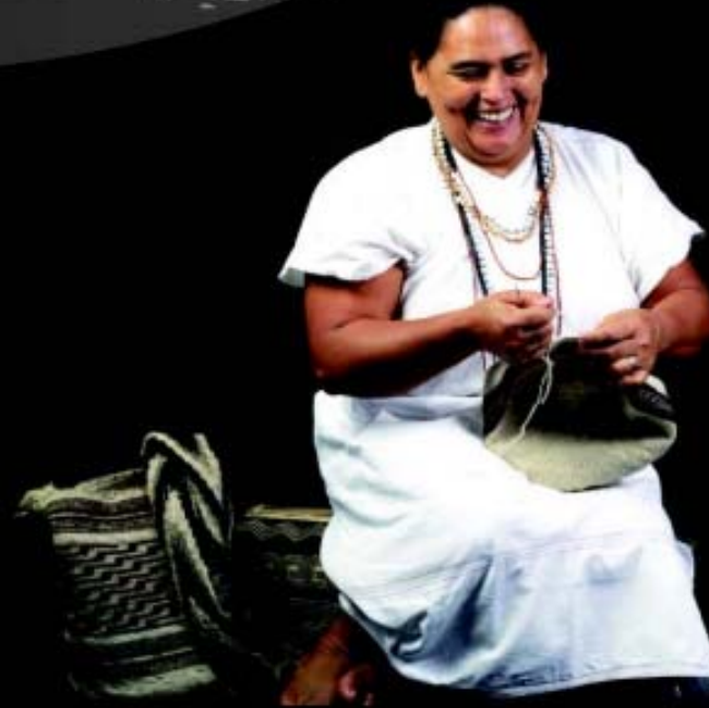
Artesana, Sierra Nevada de Santa Marta, Archivo fotográfico de Artesanías de Colombia

PROYECTO SENSIBILIZACIÓN en DERECHOS de PROPIEDAD INTELLECTUAL ASOCIATIVIDAD e INDUSTRIAS CREATIVAS ARTESANALES