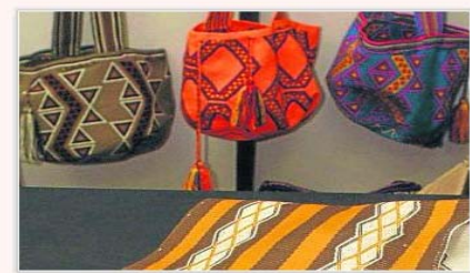
Las mochilas wayúu tendrán denominación de origen.

Sombrero Vueltiao, Filigrana de Mompox, Mochilas Arhuacas, entre otros, recibirán esta nominación. La Superintendencia de Industria y Comercio otorgó a organizaciones de artesanos la condición de titulares de seis marcas colectivas: Sombrero Vueltiao, Filigrana de Mompox, Tejeduría de Usiacurí, Artesanías de Valle de Sibundoy, las Mochilas