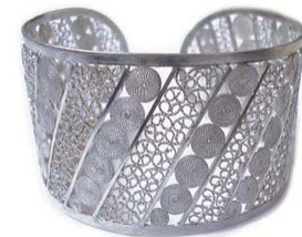
Filigrana de Mompox