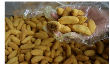
Bizcocho de Achira del Huila