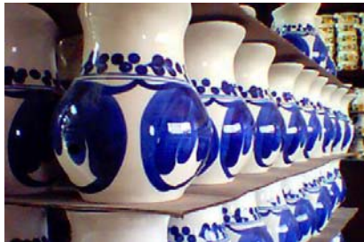
Cerámica Carmen de Viboral