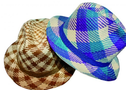
Sombreros de Sandoná (Nariño)