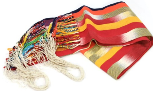
Tejeduría de San Jacinto.